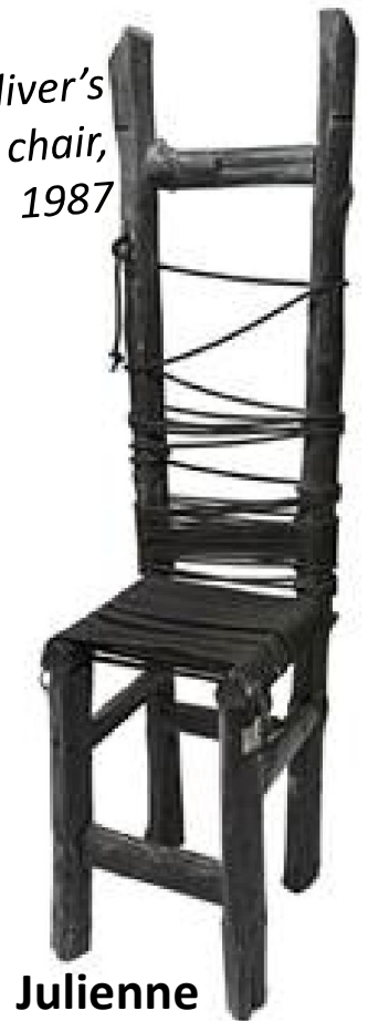
Julienne DOLPHIN WILDING