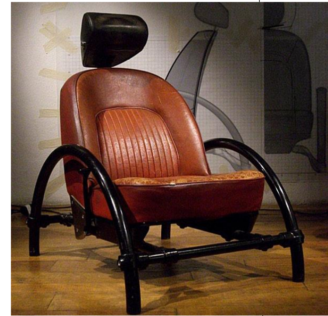
les fauteuils Rover (1981)