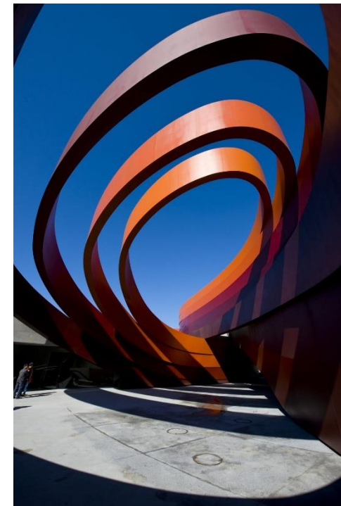
design museum holon israel musée 2006-2010 3200m2