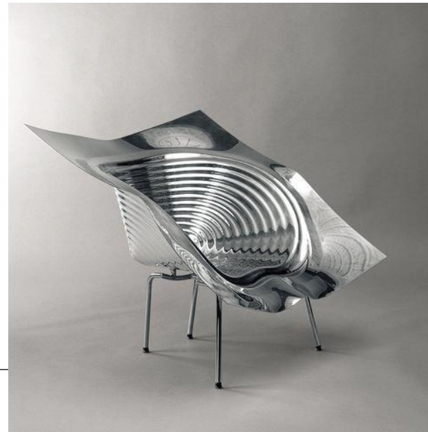
Tom Vac chair (1997)