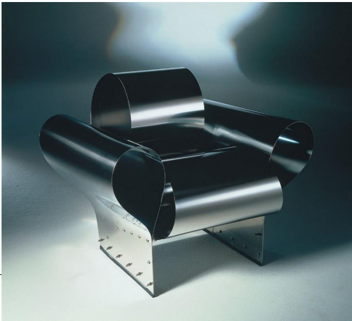
Well-Tempered Chair (1986)